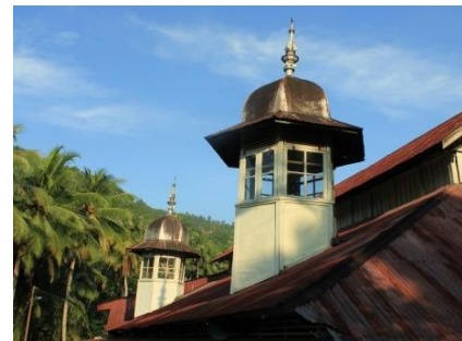
Menara Mesjid Istiqomah

Bangunan terbuat dari perpaduan antara bangunan kayu dengan bangunan tembok dan ini merupakan ciri khas bangunan yang didirikan pada masa-masa kolonial. Denahnya bangunan memanjang dengan ukuran 8x15 m, atapnya bertingkat tingkat memanjang menyerupai pelana kuda, dibagian didepan ada bangunan menonjol keluar yang dipergunakan untuk mihrab. Disisi depan dan belakang bangunan ada menara kecil yang menyatu dengan bangunan utama mesjid.