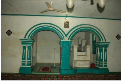
Mihrab Mesjid Istiqomah

kosong hanya didepannya kaligrafi Allah Swt, sedang mimbar terbuat dari semen tembok yang memiliki tiga tingkatan tangga.