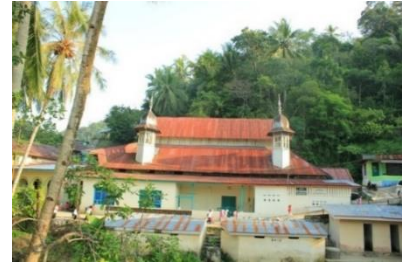
Mesjid Istiqomah Sawahlunto

Bangunan terbuat dari perpaduan antara bangunan kayu dengan bangunan tembok dan ini merupakan ciri khas bangunan yang didirikan pada masa-masa kolonial. Denahnya bangunan memanjang dengan ukuran 8x15 m, atapnya bertingkat tingkat memanjang menyerupai pelana kuda, dibagian didepan ada bangunan menonjol keluar yang dipergunakan untuk mihrab. Disisi depan dan belakang bangunan ada menara kecil yang menyatu dengan bangunan utama mesjid.