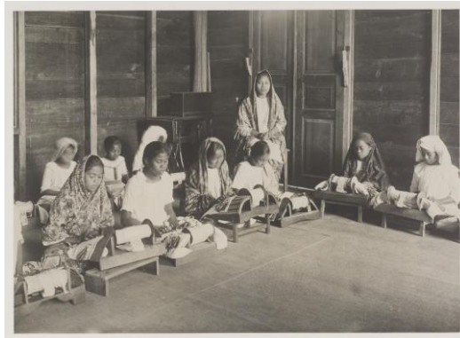
Gambar 3. Kegiatan Membuat Renda di Amai Setia