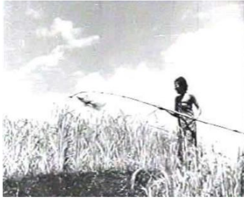
Gambar 2. Perempuan yang sedang menjaga sawahnya dari burung-burung di Padang Darat