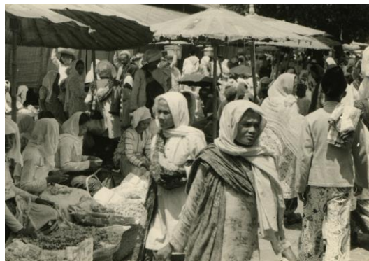
Gambar 4. Pasar in Fort de Kock

Ketiga, profesi sebagai pedagang. Umumnya, perempuan Minangkabau berbisnis dengan menjual barang-barang kebutuhan, seperti produk pertanian atau hasil kerajinan tangannya di pasar. Dalam surat kabar Soenting Melajoe , sebagian besar pasar diisi oleh pedagang perempuan dibanding laki-laki ( Soenting Melajoe , 30 November, 1912, n.d., p. 1).