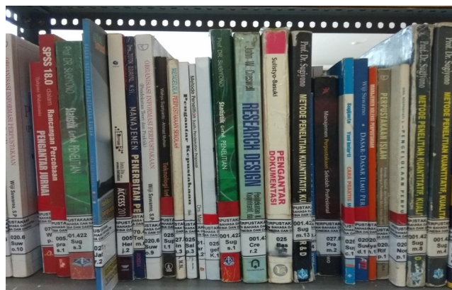
Gambar 2. Kode Buku

Di punggung buku terdapat kode sebagai petunjuk agar bahan pustaka dapat dikenali dengan mudah sesuai klasifikasinya. Kode buku sangat penting untuk mengelompokkan koleksi buku sesuai dengan jenisnya atau klasifikasinya, ini akan mempermudah mencari buku dan juga penempatan buku.