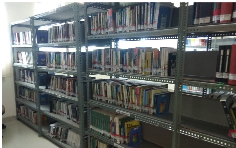
Gambar 1. Rak Koleksi Karya Umum

Perpustakaan jurusan bahasa dan sastra Indonesia dan daerah FBS memiliki koleksi bahan pustaka dari kelas 000 – 900, dari koleksi karya umum sampai dengan koleksi sejarah dan geografi. Perpustakaan jurusan bahasa dan sastra Indonesia dan daerah FBS memiliki tugas untuk mengadakan, mengolah, menyajikan, melestarikan dan juga menyebarluaskan koleksi bahan pustaka untuk kepentingan pendidikan. Salah satu koleksi bahan pustaka yang dimiliki perpustakaan jurusan bahasa dan sastra Indonesia dan daerah FBS adalah koleksi karya umum.