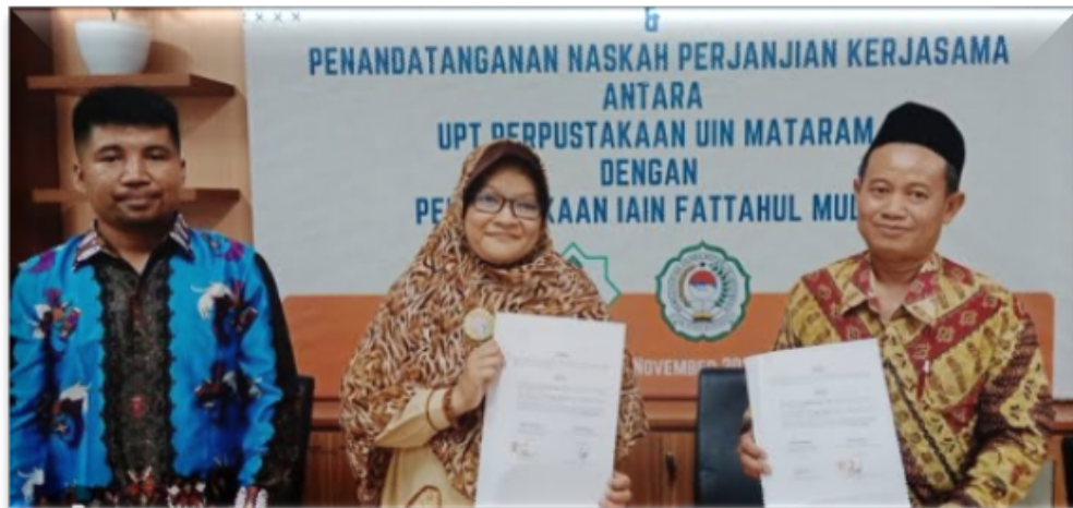
Gambar 1. Dokumentasi Kerjasama UPT Perpustakaan UIN Mataram dengan Perpustakaan IAIN Fattahul Muluk Papua

Hasil wawancara di atas, mengenai kerjasama antar perpustakaan, bahwa Kerjasama antara perpustakaan sangat penting untuk menambah informasi terbaru terkait perkembangan perpustakaan, seperti yang dikatakan oleh (Budi Wibowo, 2017) dengan adanya kerjasama antara perpustakaan akan diperoleh manfaat bagi lembaga perpustakaan itu sendiri maupun bagi pemustaka. Hasil dari kerjasama antar perpustakaan tersebut yaitu UPT Perpustakaan UIN Mataram mendapatkan manfaat yaitu mengetahui kebijakan-kebijakan dan prosedur yang bermain pada tataran teknis manajemen Repository di perpustakaan UIN Maulana Malik Ibrahim Malang, serta mempelajari customisasi e-prints langsung dengan teknisi IT Perpustakaan UIN Malang.