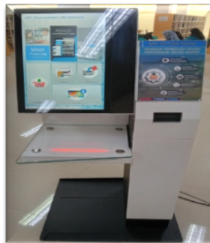
Gambar 4. Tampilan Halaman Utama RFID UIN Mataram

Radio Frequency Identification (RFID) yaitu teknologi baru nirkabel (wireless) yang telah ditetapkan di dalam dunia perpustakaan untuk mengembangkan layanan dan kinerja UPT Perpustakaan UIN Mataram dalam hal identifikasi dan keamanan, RFID ini juga merupakan layanan mandiri atau self service untuk meminjam dan mengembalikan buku.