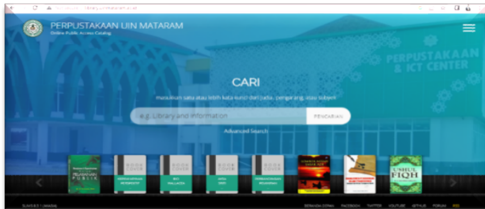
Gambar 3. Tampilan Halaman Utama OPAC UIN Mataram

Online Public Access Catalog (OPAC) UPT Perpustakaan UIN Mataram adalah sistem katalog terpasang, software yang digunakan yaitu SLiMS 8 (Akasia). OPAC ini bersifat open access dan juga, pengguna dapat mencari informasi katalog untuk memeriksa apakah perpustakaan memiliki karya tertentu pada file untuk mendapatkan informasi tentang lokasi mereka. Ketika sistem katalog dihubungkan dengan sistem distribusi, pengguna dapat mengetahui apakah bahan pustaka yang dicari ada di perpustakaan atau dipinjamkan. OPAC merupakan kemajuan teknologi dalam ilmu perpustakaan. Ini tidak hanya memberikan kemudahan bagi pengguna, tetapi juga memfasilitasi kegiatan katalogisasi pustakawan.