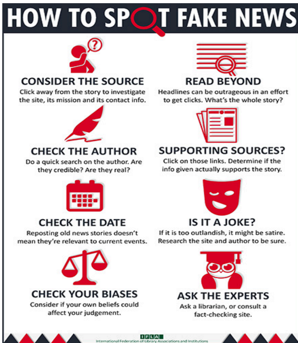
Gambar 3. How To Spot Fake News Poster (IFLA)

IFLA sendiri telah mengeluarkan langkah-langkah bagaimana mengenali suatu informasi apakah fakta atau HOAX. Terdapat 8 tahapan yang perlu diperhatikan (Eugene Kiely and Lori Robertson, 2016) yaitu: