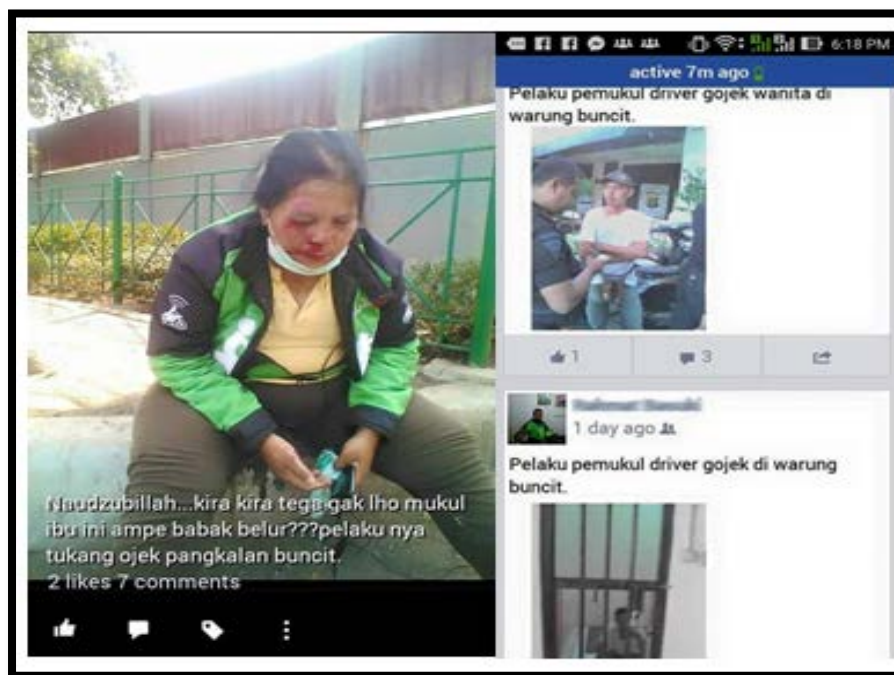
Gambar 1. Berita hoax driver gojek korban pemukulan

Contoh kasus lain berita yang beredar di sosial media berkaitan dengan pemukulan ibu pengendara GOJEK, yang kemudian diulas oleh Samuel Henry (dalam situs kompasiana.com , 25 Juli 2015). Setiap orang yang melihat foto berikut akan merasa kasihan kepada si Ibu, dan marah serta emosi pada orang yang dituduhkan sebagai pelaku. Dengan cepat berita tersebut menyebar di sosial media, berbagai caci maki, umpatan serta kata-kata yang tidak pantas ditujukan kepada pelaku. Hingga muncul klarifikasi dari pihak GOJEK, bahwa si Ibu driver GOJEK bukan korban pemukulan melainkan korban kecelakaan tunggal di fly over Tanah Abang, namun disayangkan berita sudah terlanjur menyebar.