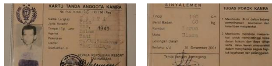
Gambar 3.0 Dokumentasi Kartu Pengenal