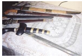
Gambar 4.0 Dokumentasi Senjata Cadangan