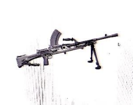
Gambar 5.0 Dokumentasi Senjata yang pernah dipakai TII