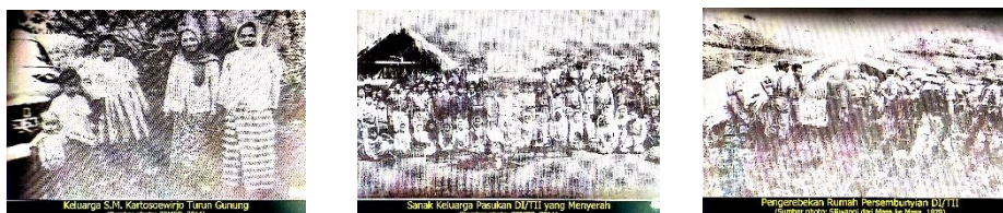
Gambar 2.0 Dokumentasi DI/TII