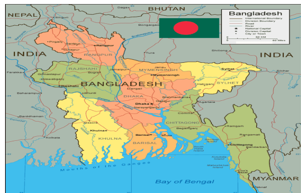
Gambar 1: Peta Bangladesh

Setelah Pakistan Timur resmi berpisah dengan Pakistan Barat, maka nama Pakistan Timur berubah menjadi Bangladesh, yang beribu kota Dakka. Wilayah ini terletak di dataran rendah aliran sungai Brahmana dan Gangga. Di bagian barat, Utara dan timur berbatasan dengan India, bagian tenggara berbatasan dengan Burma, bagian selatan dengan Teluk Benggala. 6