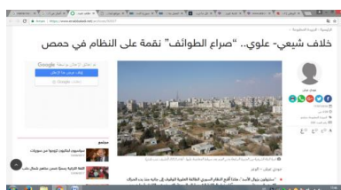
Salah satu frame pemberitaan konflik Sunni-Syi'ah di balik prahara Suriah pada www.enabbaladi.net

Orientasi pemberitaan media-media Suriah yang lebih cenderung pada isu politik tersebut membuat wacana konflik sunni dan syi'ah hanya menempati posisi isu sekunder –atau bahkan tersier- sebagai latar belakang terjadinya prahara Suriah (Fahham dan Kartaatmaja, 2014: 45). Golongan sunni dan syi'ah telah lama hidup berdampingan dalam kemajemukan. Posisi-posisi penting di pemerintahan juga diisi oleh elit kedua golongan tersebut, dipilih secara demokratis tanpa pandang bulu (Sulaeman, 2013: 20-21). Kedewasaan rakyat dalam beragama membuka ruang toleransi yang tinggi sehingga tidak mudah dibenturkan dengan isu-isu sektarian. Oleh karena itu, peredaran wacana dengan ‘kata kunci’ konflik sunni dan syi'ah tidak begitu masif dan hanya diletakkan dalam kerangka sebagai potensi pendukung membesarnya konflik. Salah satu bentuk pemberitaan di media Suriah dapat kita lihat pada gambar berikut: